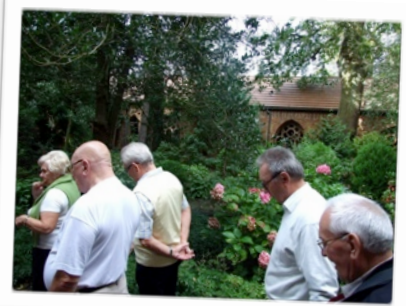
W zadumie zmyrzamy do Katedry