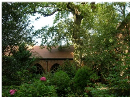
Ostatnie spojrzenie na ogród.