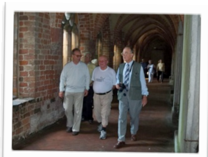
Jesteśmy pod wrażeniem przeszłego czasu.