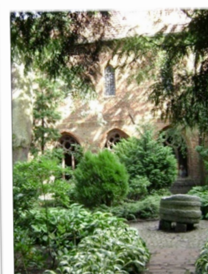
Na pierwszym planie chrzcielnica o której mowa w opisie.