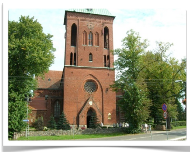
Katedra w Kamieniu-Pomorskim

Wirydarz w głębi po lewej stronie Katedry