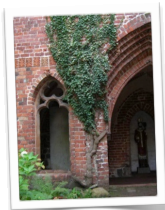
Krużganek w zieleni.